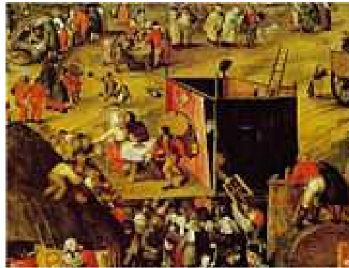
« La Foire paysanne », par Pieter Balten, XVIe siècle Représentation théâtrale de la fin du Moyen Âge.

http://fr.wikimini.org/wiki/Théâtre_au_Moyen_Âge